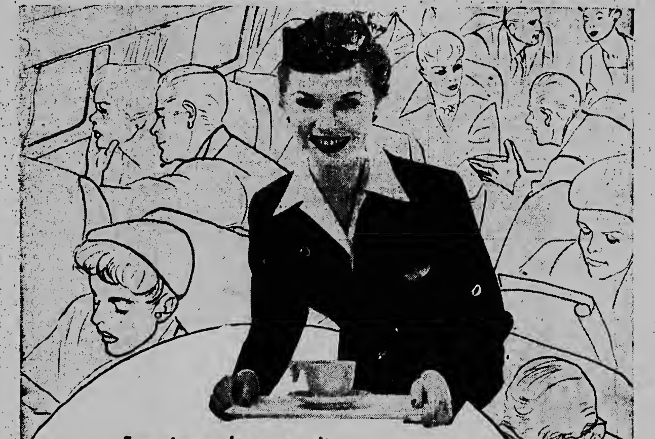
Een stewardess vertelt ...